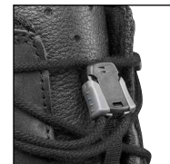
HAIX® Smart Lacing