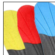
Vario Wide Fit System